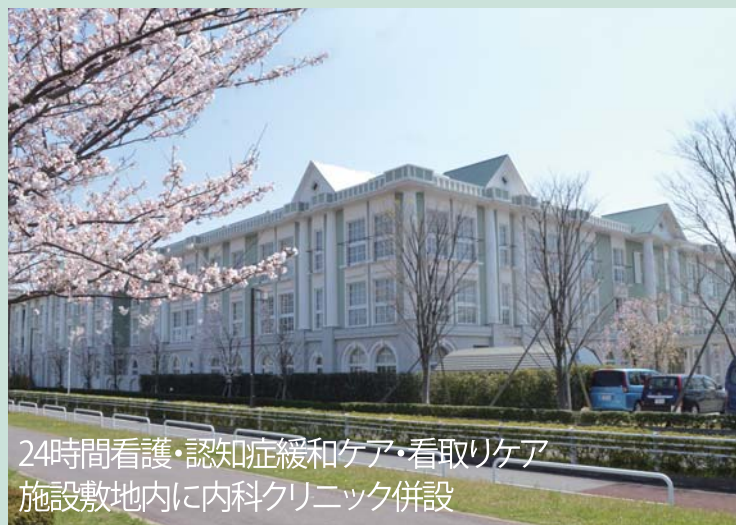
24時間看護・認知症緩和ケア・看取りケア 施設敷地内に内科クリニック併設